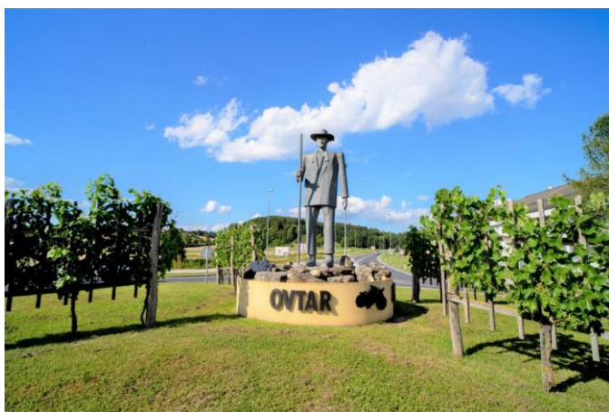
Slika 2: Skulptura ovtarja v Lenartu

Blagovna znamka Ovtar predstavlja zaščiteno blagovno znamko od leta 2007. Danes je Ovtar kot blagovna znamka Slovenskih goric pojem za tradicijo, poreklo in kvaliteto ponudbe podeželja Slovenskih goric (kulinarične, vinske, kulturne, turistične, ekološke, domače umetnostne obrti ...). Razvojna agencija Slovenske gorice (TIC Lenart) tako pod skupno lokalno blagovno znamko Ovtar posebej skrbi, promovira, širi in razvija Ovtarjevo ponudbo pridelkov, predelkov in izdelkov. Ovtar je na področju Slovenskih goric spoštovan izraz. Ker je lik ovtarja tesno povezan z zgodovino in preteklostjo Slovenskih goric in tukajšnjega prebivalstva, krasi Lenart, ki je središče Slovenskih goric, skulptura ovtarja.