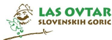
Slika 3: Logotip znamke Las Ovtar