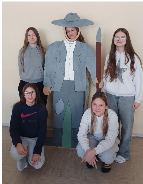
Slika 4: Foto točka iOvtar s Saro, Ulo, Zojo, Evo in Majo

Foto točka in instagram skupaj delujeta kot močno promocijsko orodje, ki spodbuja obisk, krepi prepoznavnost iOvtarja in povezuje tradicijo s sodobnimi digitalnimi trendi. Naša foto točka vključuje ovtarja, ob katerem se lahko vsak fotografira in sliko objavi na svoji Instagram strani, hkrati pa označi naš Instagram profil. Foto točka vključuje tudi QR kodo, ki obiskovalce usmeri na interaktivni predstavitveni pano iOvtarja in na igrici. Ob objavah na Instagramu se lahko uporabijo tudi »hashtag« oznake, kot so #iOvtar, #ovtar, #slovenskegorice, #visitgorice.