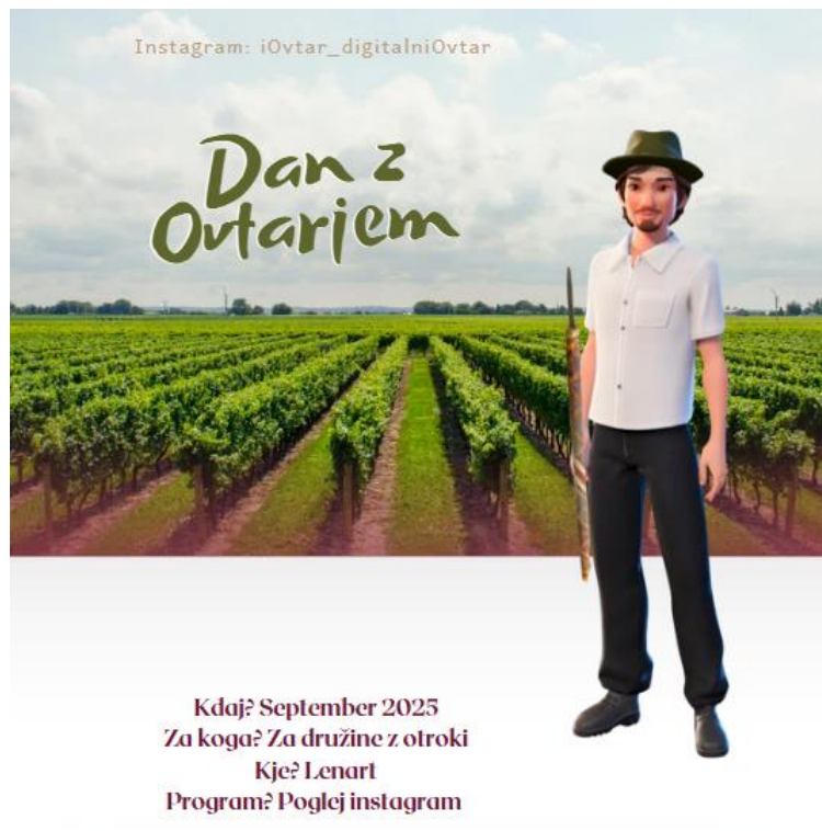
Slika 7: Vabilo na »Dan z Ovtarjem«