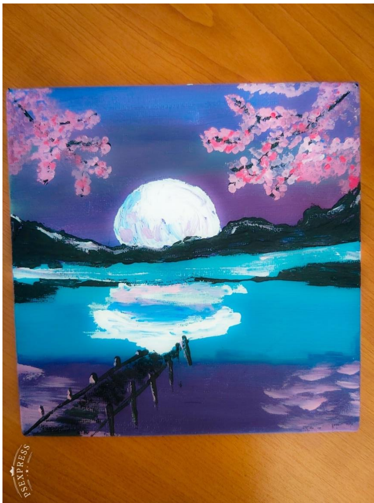
Tamara Rotar, 9.č